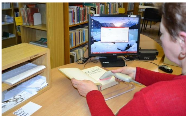
inicializácia etikiet – čipovanie kníh