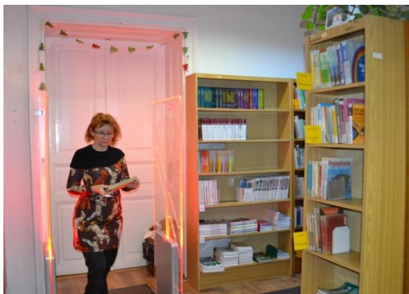
ochrana knižného fondu RFID technológiou a detekčná brána