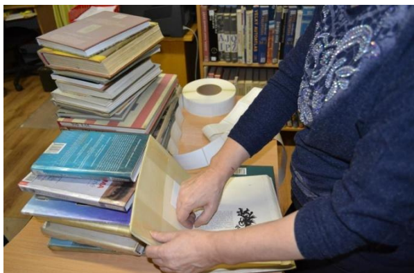
Lepenie čipov do kníh